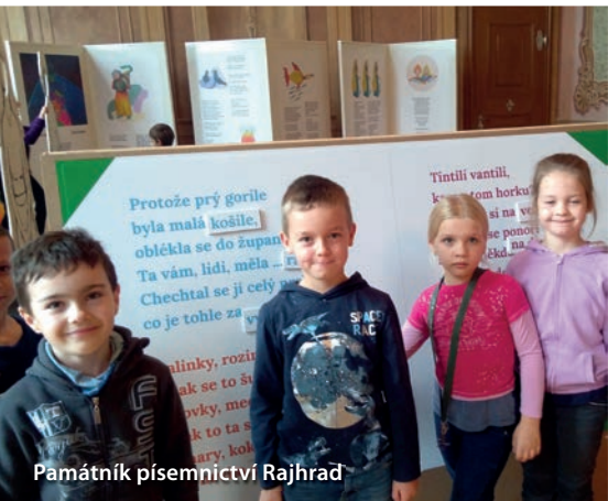
Památník písemnictví Rajhrad