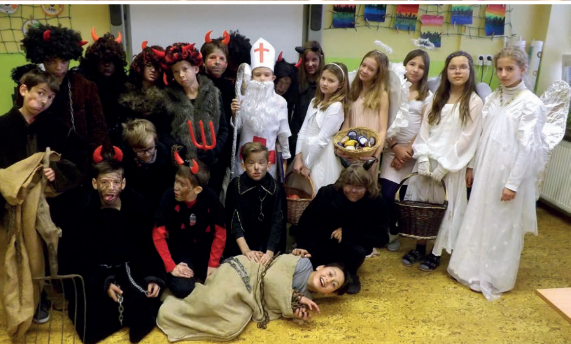
Mikuláš ve škole