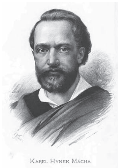
KAREL HYNEK MÁCHA