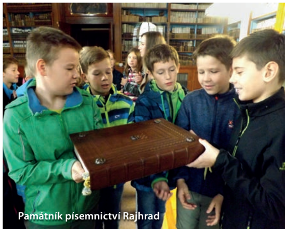
Památník písemnictví Rajhrad