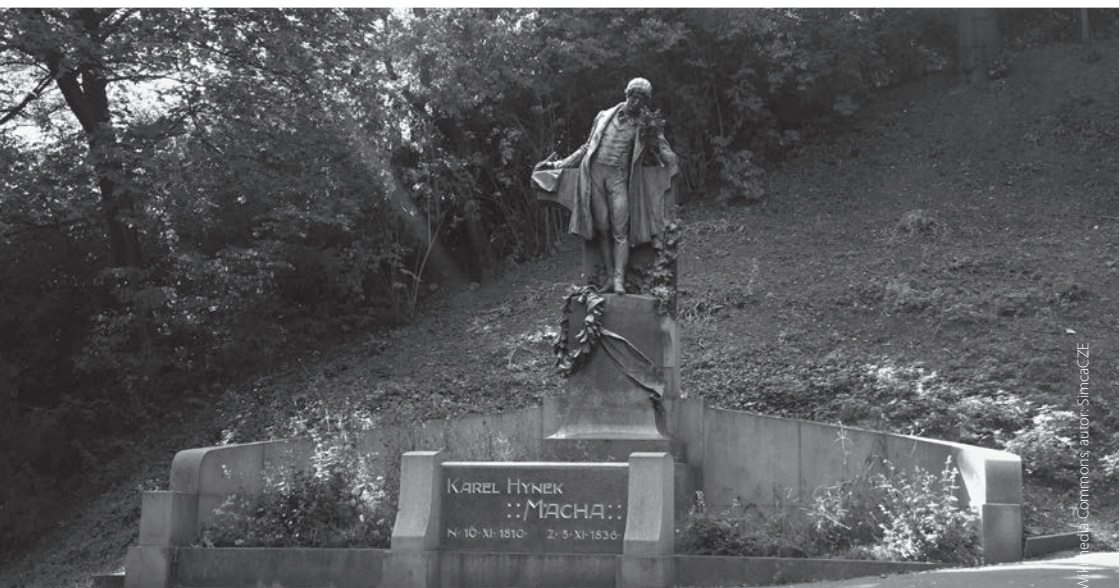
Socha Karla Hynka Máchy v Petřínském parku v Praze