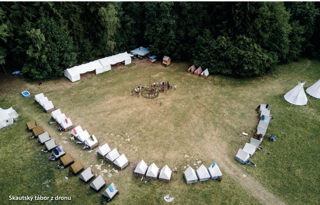
Skautský tábor z dronu