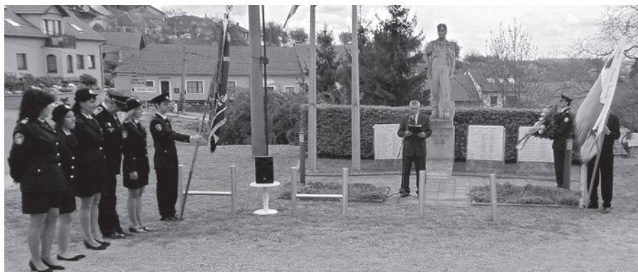
^ Pietní akt k osvobození obce u příležitosti 70. výročí ukončení II. svět. války

Během dlouhých válečných let zemřelo na bojištích, popravištích a v koncentračních táborech 18 našich občanů.