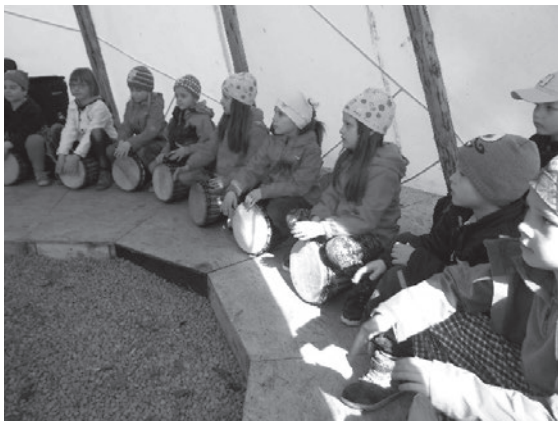
^ Bubnování v týpí

časnosti školy, vytiskneme kroniku školy, roztrídíme a popíšeme fotodokumentaci (hodně fotodokumentace), vydáme školní časopis (nejdřív ho děti musí napsat), sesbíráme a vystavíme dobové reálie, natiskneme trička s logem školy, zasadíme strom, jako připomínku významného jubilea (Jaký strom? Je okrasná jablň dostatečně jubilejní?) nacvičíme s dětmi vystoupení, donutíme děti, aby si oblékli kostýmy a aby tančily, zajistíme výzdobu školy, aby byla informativní, ale ne nudná, bude potřeba party stan, bečka piva, bečka limonády, upomínkové předměty, skákací hrad, nějaké občerstvení... V květnu jsme zjistili, že nic není nemožné, vyučovat se dá i za pochodu a spánek je jenom zvyk.